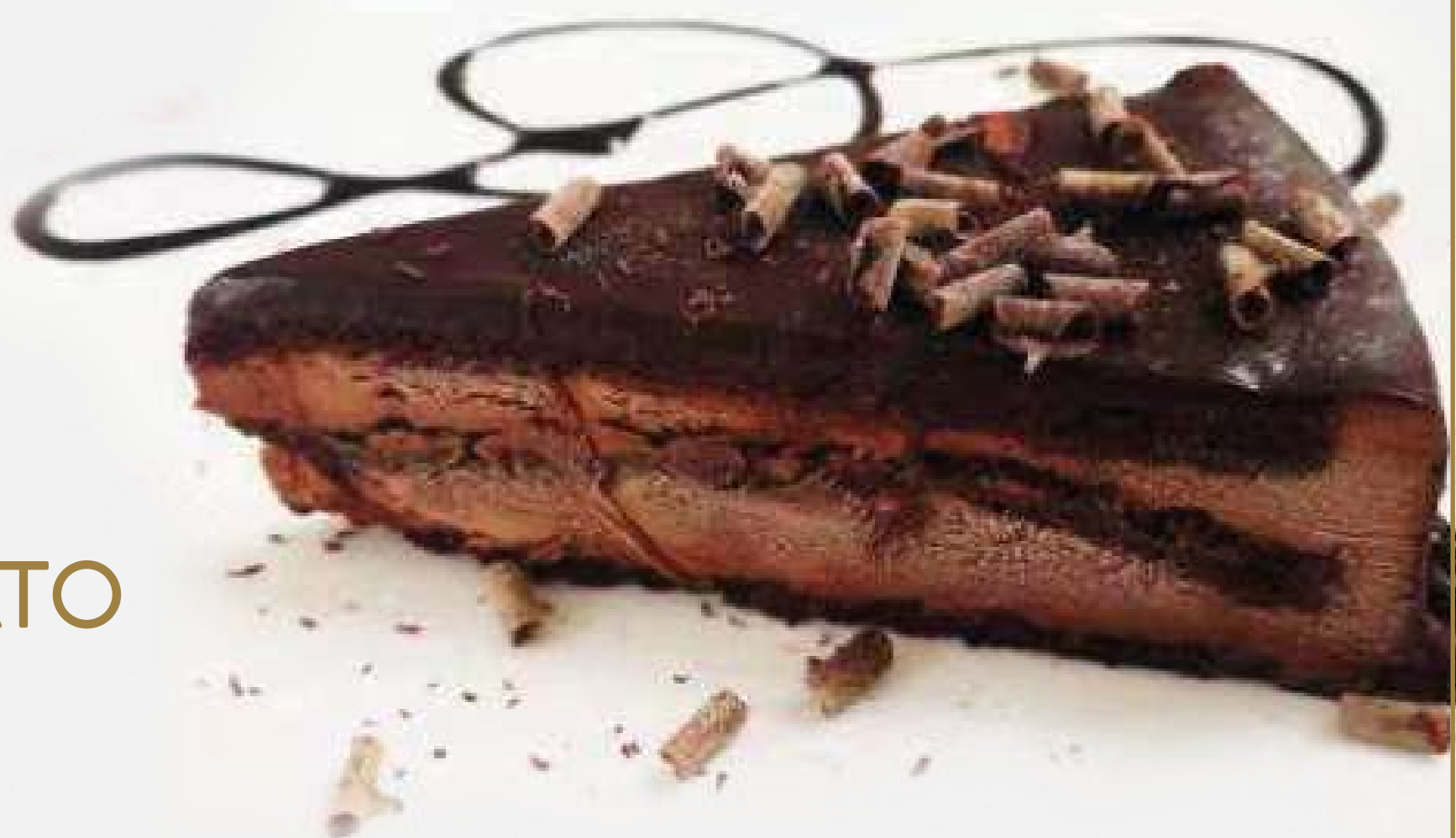
TORTA AL CIOCCOLATO € 5,00