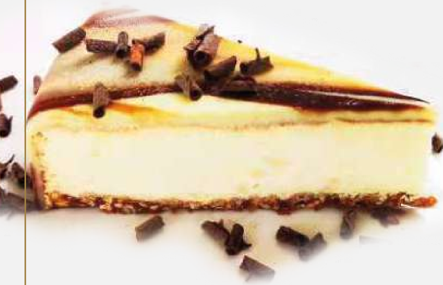
TORTA DI RISO